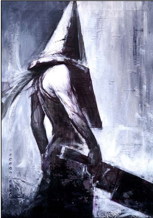
Masahiro Ito, Pyramid Head , 2012